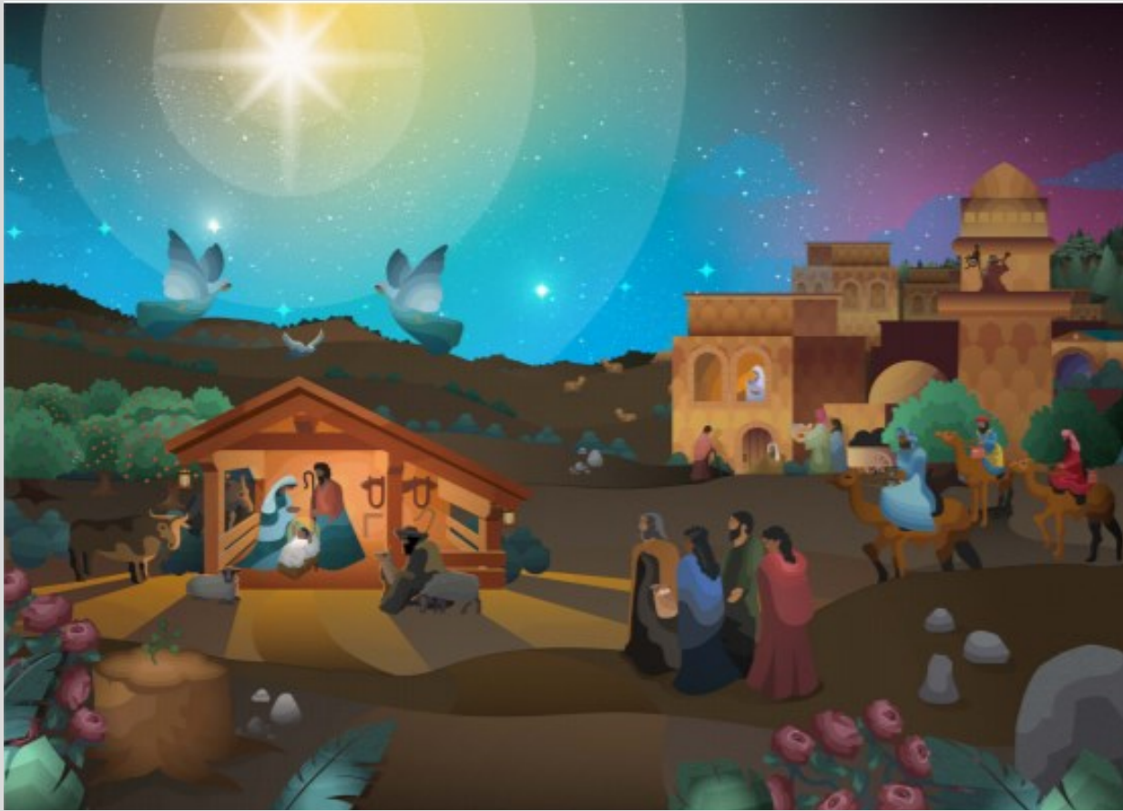
L'Association catholique de la santé des États-Unis

Luc 2, 9-11 - L'ange du Seigneur se présenta devant eux, et la gloire du Seigneur les enveloppa de sa lumière. Ils furent saisis d'une grande crainte. Alors l'ange leur dit : « Ne craignez pas, car voici que je vous annonce une bonne nouvelle, qui sera une grande joie pour tout le peuple : Aujourd'hui, dans la ville de David, vous est né un Sauveur qui est le Christ, le Seigneur. »