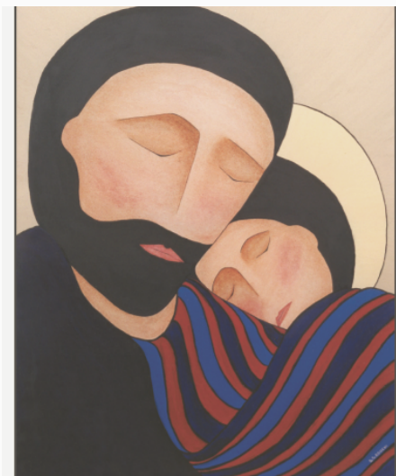
JOSEPH AND THE CHILD © GISELE BAUCHE, SPIRITUALITYANDART.CA. UTILISÉ AVEC AUTORISATION.